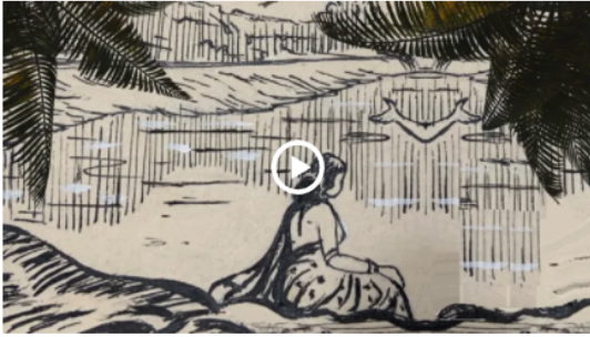
Two Seedlings - by Vijay Saravanamuthu