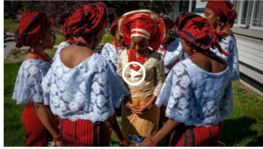
Tethered - by Deborah Ocholi