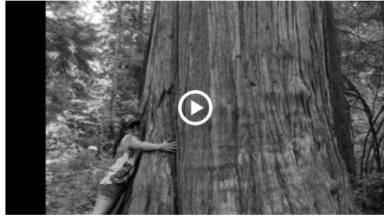
To: From: - by Nadieshda Curiel Cisneros